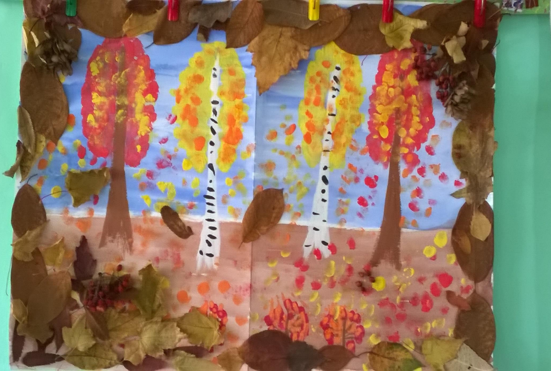
Коллективная комбинированная работа «Волшебная осень»